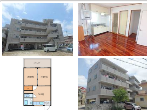
【モノレール】壺川駅／徒歩約26分